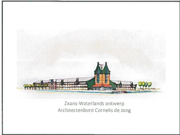
Zaans-Waterlands ontwerp Architectenburo Cornelis de Jong